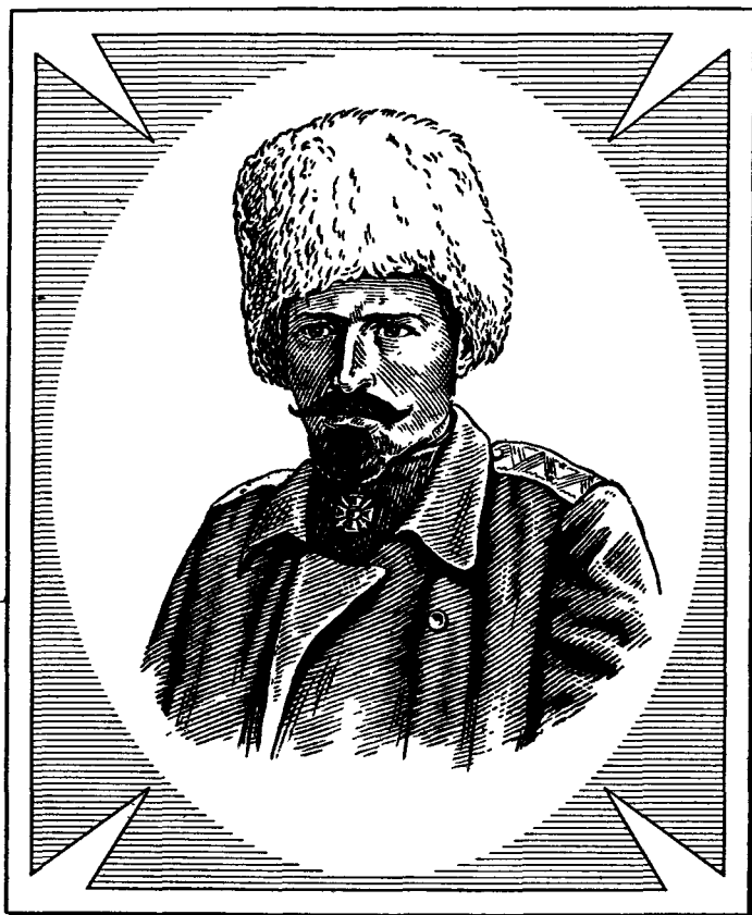
МАРКОВ Сергей Леонидович 1878–1918